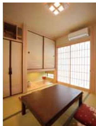
建具のデザインや柱の見せ方に凝り、あえて昔ながらの和空間を演出。

山内建匠の完成見学会を訪れ、本物の木のよさを生かした匠の技の家づくりに惹かれて同社を選んだ一夫妻。和モダンなデザインにこだわった邸内は、和洋素材が見ごとに調和したシックで上品なつくり。手加工仕上げによる天然木の柱や建具が目を引きほか、夫人自慢のスタリッシュなキッチンや、バンドが趣味という主人のリクエストで実現した自宅スタジオなど、一家ならではのこだわりが満載だ。細かいところまで入念に打合せを行い、建築中は現場に何度も足を運んだという夫妻。「施工風景を見るのが楽しくて、行くたびにテンションが上がりました」という念願のマイホームだけに、完成の喜びはひとしお。お気に入りのソファに腰かけて仲睦まじく語り合うその笑顔が、住み心地のよさを物語る。