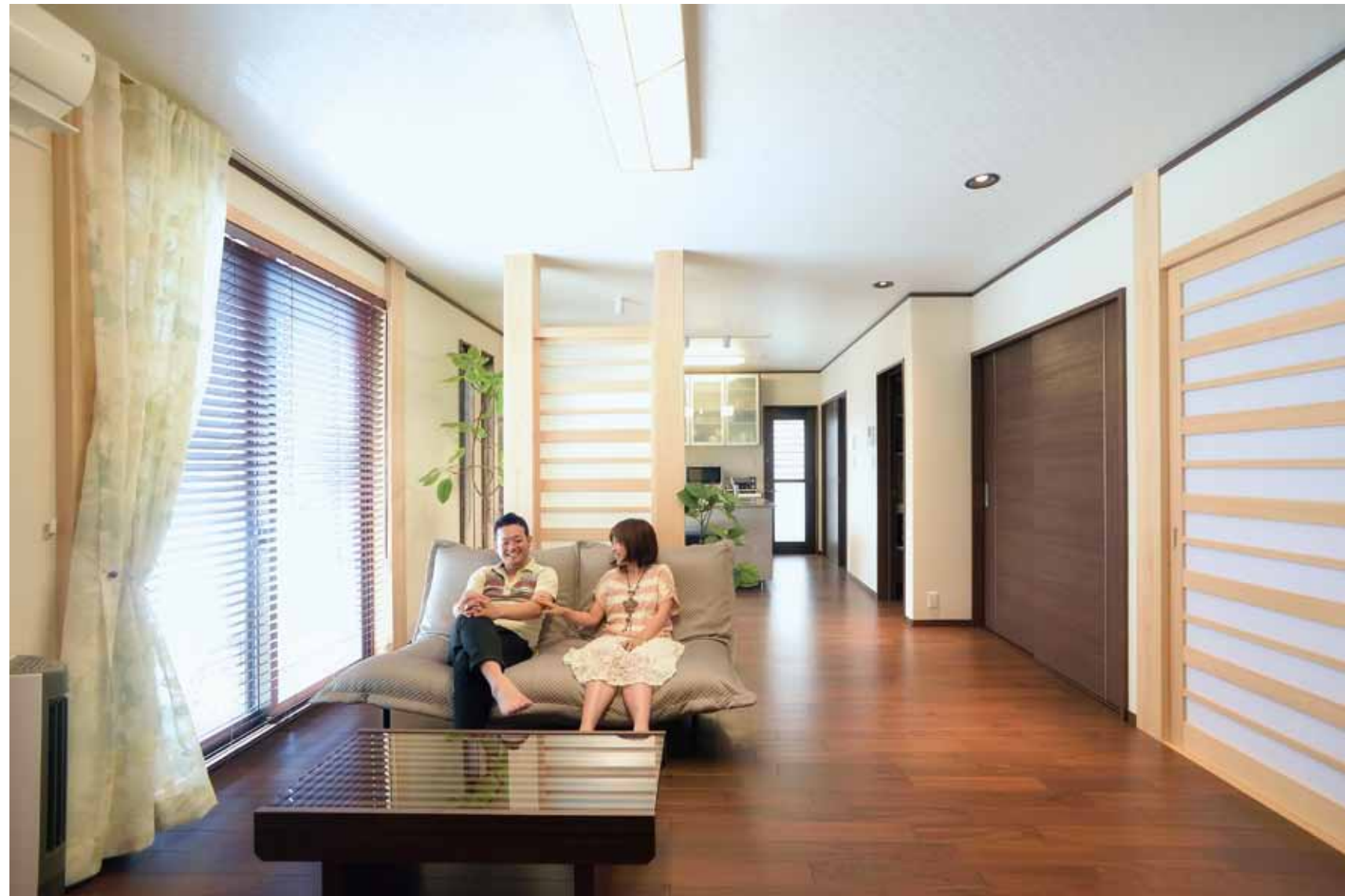
和洋素材をバランスよく取り入れた、ワンフロアのひろびろLDK。リビングとDKの間に設けた目隠しの建具パネルが、和モダンなデザインのアクセントにもなっている。