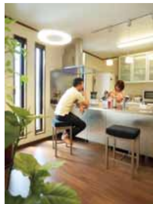
ダイニングカウンターつきで便利。スツールも同メーカーで統一。