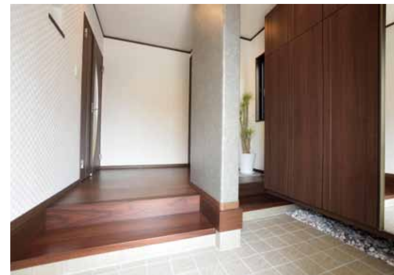
客用と家族用とを分けたダブル玄関。洋風のシックなつくりと、小石を用いた和テイストのインテリアが絶妙にマッチ。