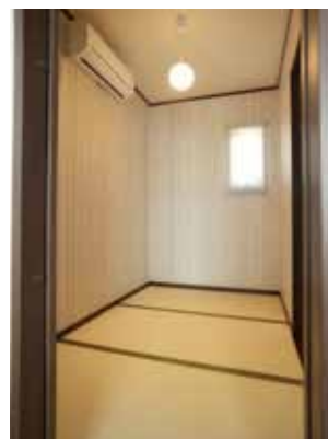
こたつでほっこり過ごしたいという夫人専用の書斎兼プライベートルーム。

設計・施工 / 山内建匠(有) ☎0897-41-0755 企業情報 - P000