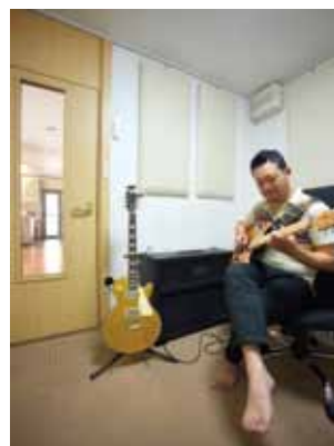
二重扉や遮音壁など本格的な防音機能を備えた自宅スタジオ。