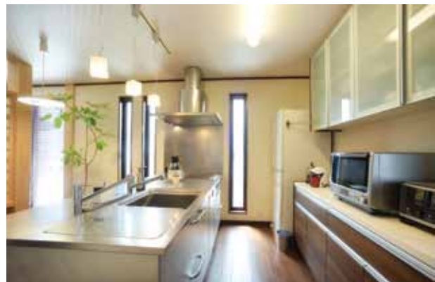
完成見学会で夫人が目惚れしたというトニーキッチンシステムキッチンを採用。背面収納の色や素材にもこだわりが。