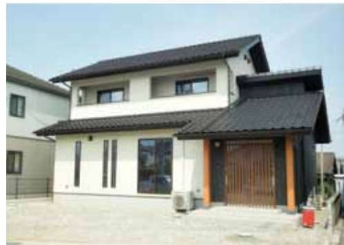
和モダンに仕上げた外観は、鳥居風にデザインされた玄関がポイント。深い軒先と格子の引き戸が優美さと厚重感を演出。