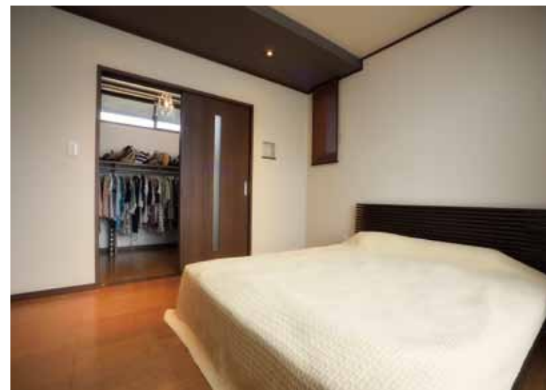
2階の主寝室も落ち着いた内装で統一。造作の棚やハンガーを設けた大容量のウォークインクローゼットを併設し、すっきり収納を実現。