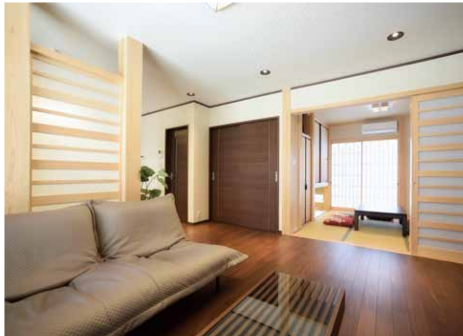
リビングの横には客間としても使える和室をプラス。造作の引き戸とソファ背面の目隠しパネルには天然の無垢材を使用し、デザインをそろえたのもポイント。