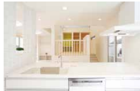
キッズスペースの子どもの様子を炊事をしながらみることができる。