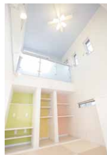
2階廊下からもキッズスペースの様子がみられる。計算された生活動線。

「我が家ももっとも居心地がいい場所」という想いで家づくりを行なっている山内建匠、創業から三代に渡る大工匠家として、新築・建替え・修繕・修理など、数多くの実績を積み上げてきました。その信頼と実績は、丁寧な手仕事によるものです。例えば、一口にしかわからない部分である、材木を切り組む切組、皇付を手作業で行なっているのもそのひとつ。プレカットのように生産ラインにのって均一な商品を作ることも大切かと思いますが、私たちの作る家では、職人がその家のためにだけに柱を一本づつ木のクセを見ながら星をつけていきます。その木と木の接合部は、台持継ぎ手や金輪継ぎ手といったプレカットではできない強固な継ぎ手に仕上がります。今では取り入れる家が少なくなったこの技法