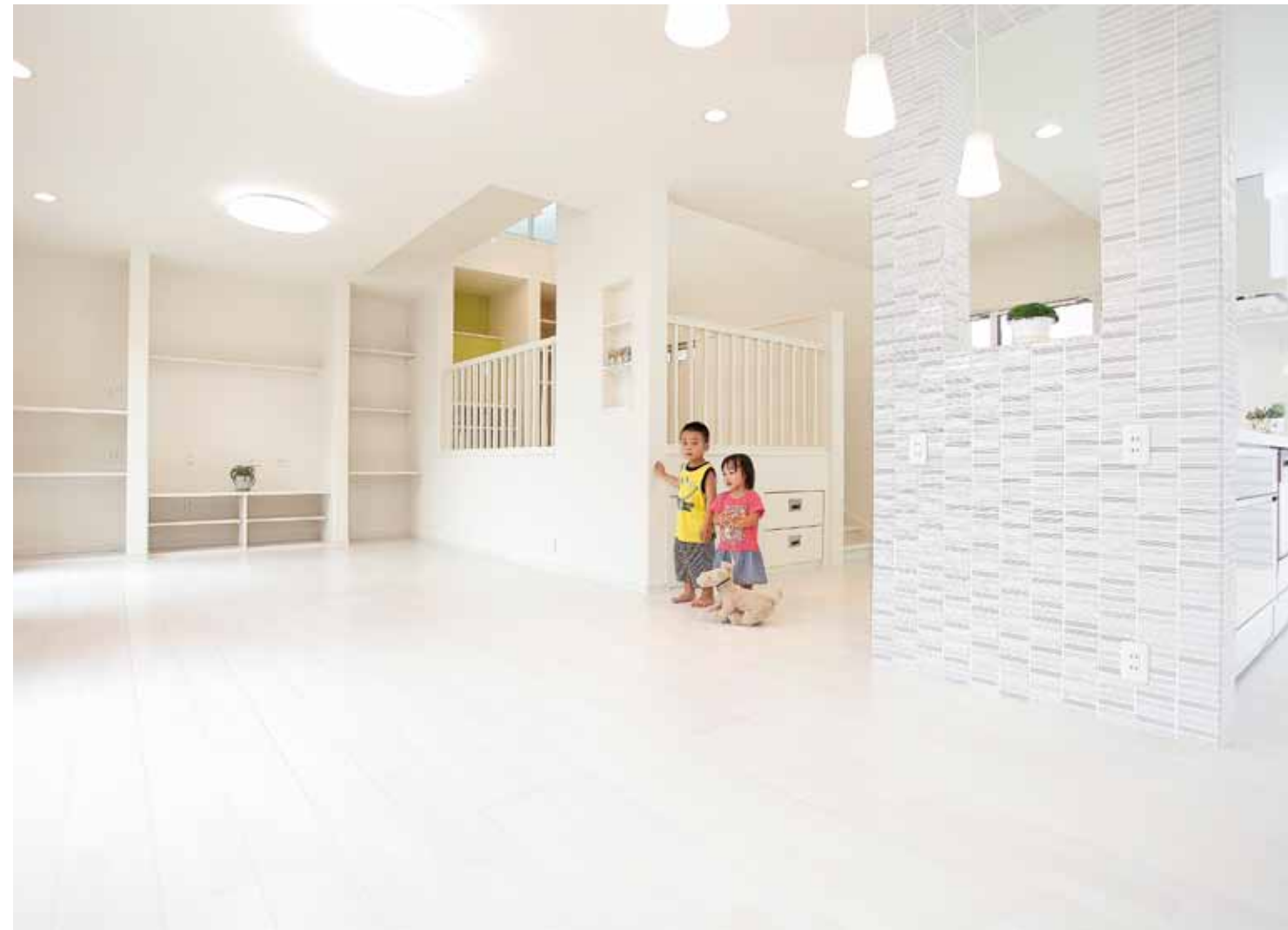
ホワイトで統一されたリビングキッチン。中央には床を高くしたキッズスペースがある。