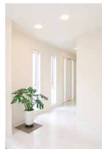
玄関もホワイトで統一。インテリアは白いキャンバスに絵を描く様にコーディネート出来る。

は、山内建匠の上棟に立ち会うことで実感していただけたと思います。さらに私たちは、木造住宅の持つ良さを引き立たせるために、培われた技と現代の技を融合した家づくりを行なっています。新築、リフォームともに、現在よりも住み心地がよい家を提案できるよう、施工方法や工事金額など希望に応じて、じっくりと打ち合わせをするのも特徴です。計画段階で、何気ない想いや希望、夢、こだわりなど、多くの話をお聞きし、そのイメージをもとに、平面・立面、三次元へとデータ化し、図面を仕上げます。決められた予算のなかで、ご希望通りのカタチがつかれるか、匠や職人の知恵と豊富な経験からアドバイスもさせていただきます。予算内で、予算以上の満足をご提案いたします。