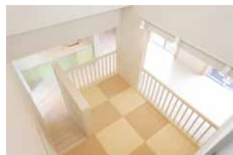
キッズスペースは裸足にもやさしい畳を採用。