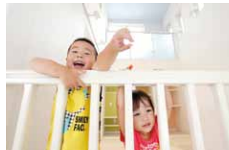
キッズスペースでご機嫌のご兄妹。