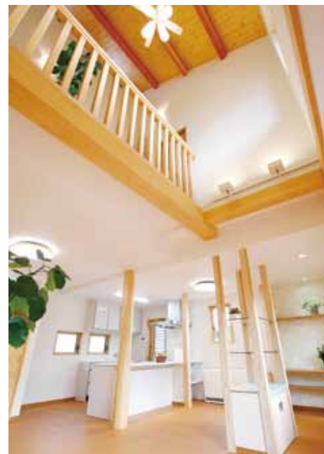
木の色とホワイトが調和したリビング。