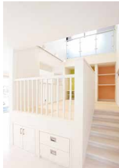
キッズスペースの床下は収納として活用。