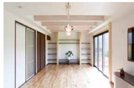
明るく塗装された梁が、広々とした空間を演出。