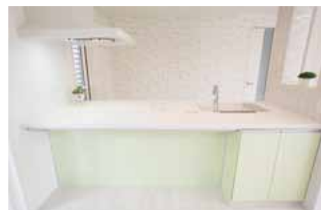
ホワイトで統一されキッチン。パステル色を効果的に配置。