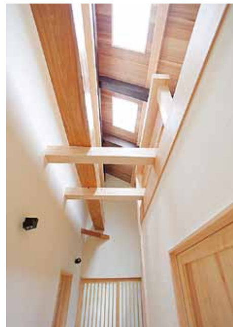
大胆に太陽光を取り入れた光の廊下。